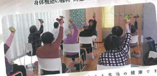
心身ともに健康であることこそ本当の健康です

デイサービスは通所介護ともいい、送迎付きで食事や入浴、レクリエーションなどを受けられます。 永楽荘では機能訓練を取り入れており、利用者様の身体状況に合わせた個別性の高いプログラムを提供することで、身体機能の維持・向上に繋がっています。